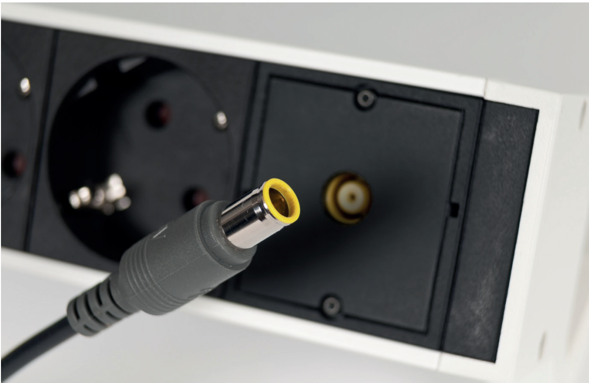
Abbildung 3: Innovatives LV-DC-Steckersystem: lichtbogenfrei, anwendungsspezifische Ausgangsspannung, kein Standby-Leistungsverbrauch