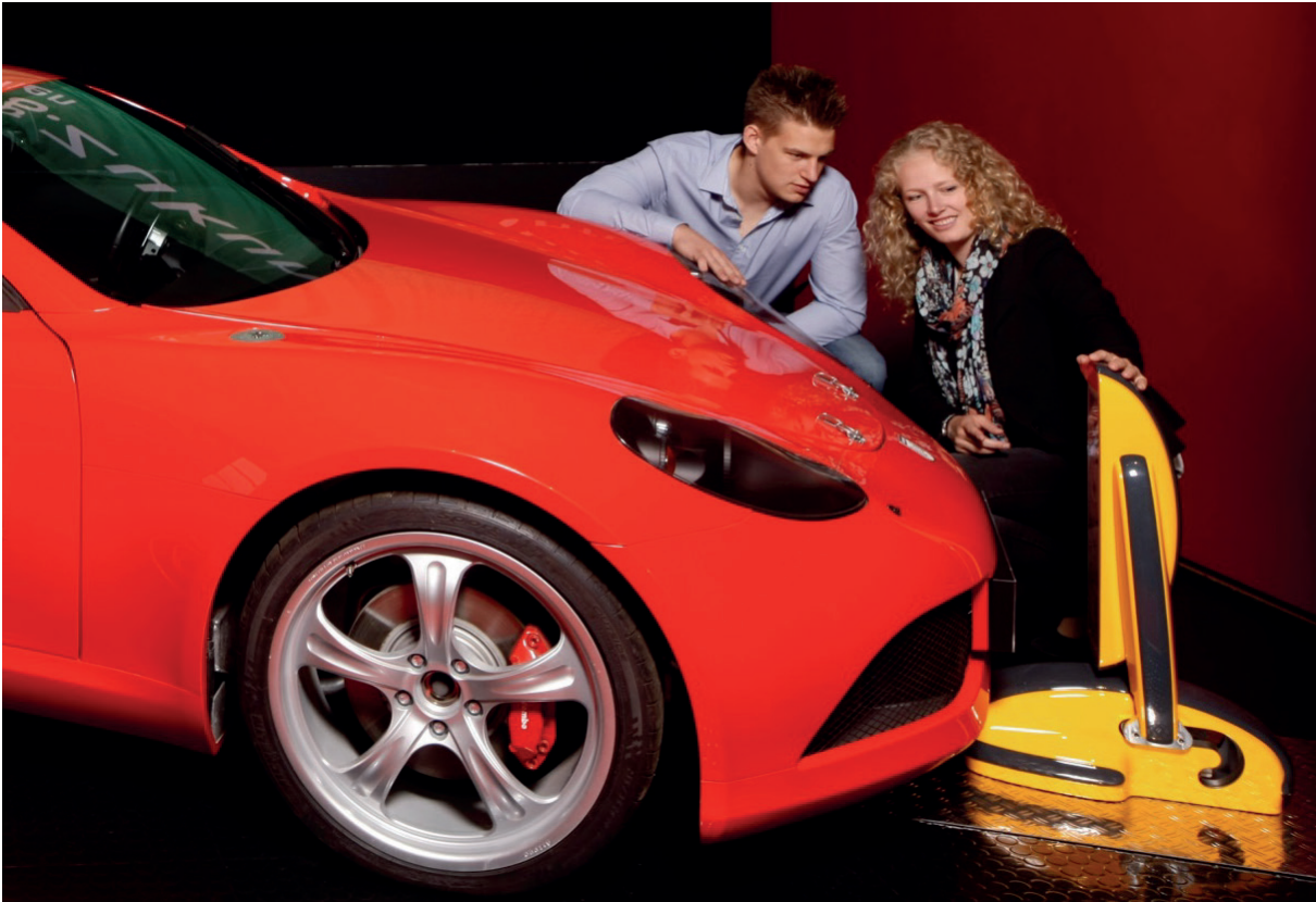
Abbildung 2: Induktives Ladesystem des Fraunhofer IISB