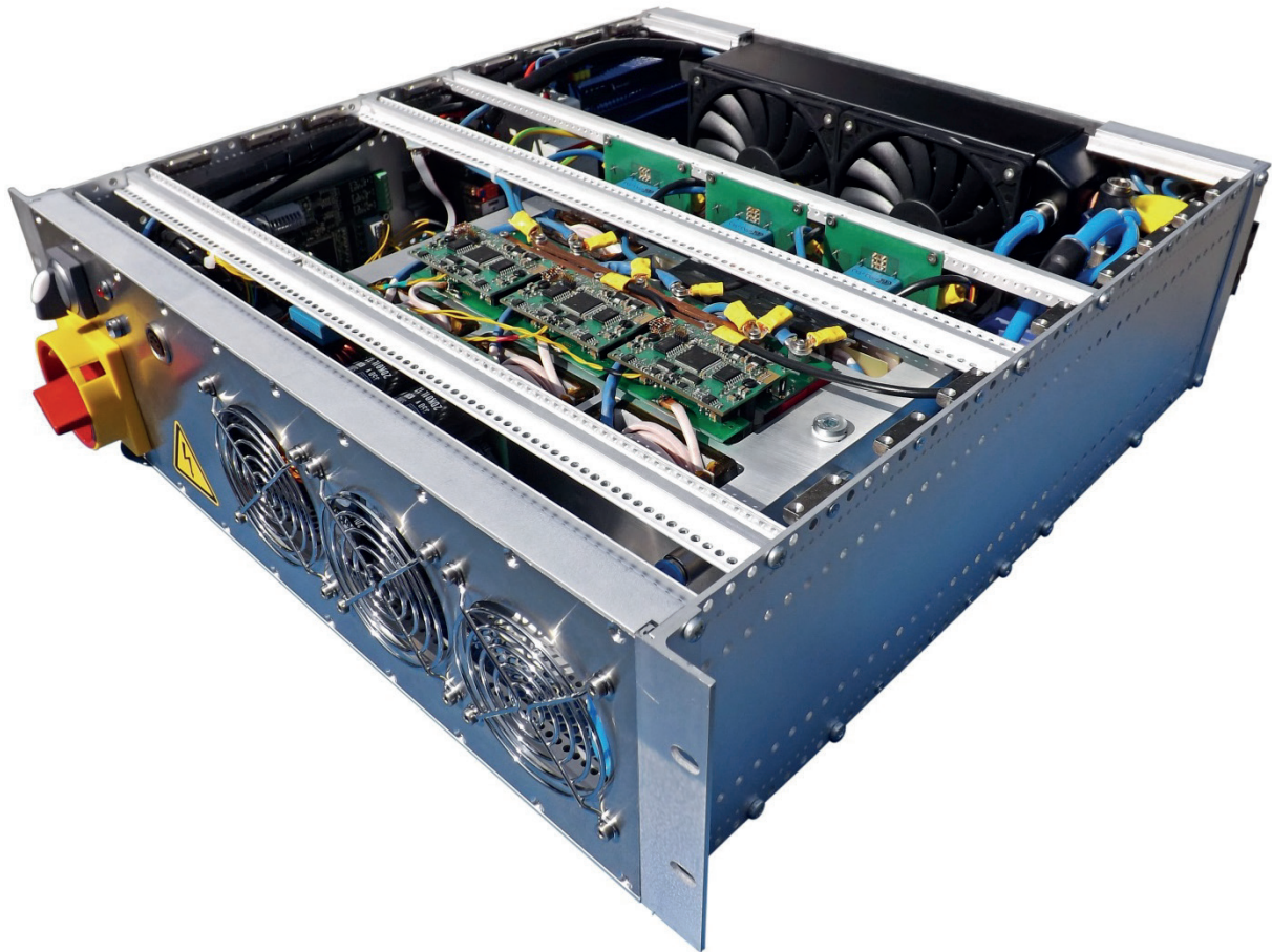
Abbildung 1: „DC Micro Grid Control System“ des Fraunhofer IISB

Für das „elektrische Betanken“ von Elektrofahrzeugen zeigt das IISB auf der PCIM Europe sein induktives Ladesystem, das geometrisch als frontales, bidirektionales Lade-/Entlade-System über eine Spulenanordnung hinter dem vorderen Nummernschild konzipiert ist (Abbildung 2). Dieser modulare Ansatz, der mit einer Übertragungsleistung von 3 Kilowatt pro Modul und Frequenzen bis zu 150 Kilohertz arbeitet, zeichnet sich durch einen hohen Übertragungswirkungsgrad von 93%, hohen Personenschutz durch geringe Streufelder, eine hohe Positionstoleranz und sehr kostengünstige Realisierbarkeit aus.