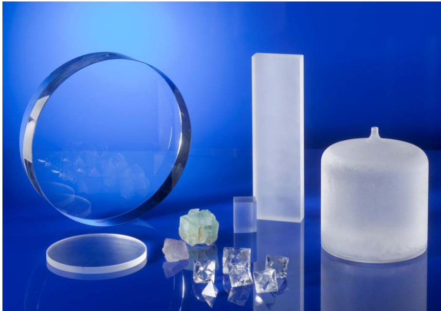
Natürliche und im Labor am Fraunhofer IISB hergestellte Kalziumfluorid-Kristalle für UV-Lichtbrechende Linsen.