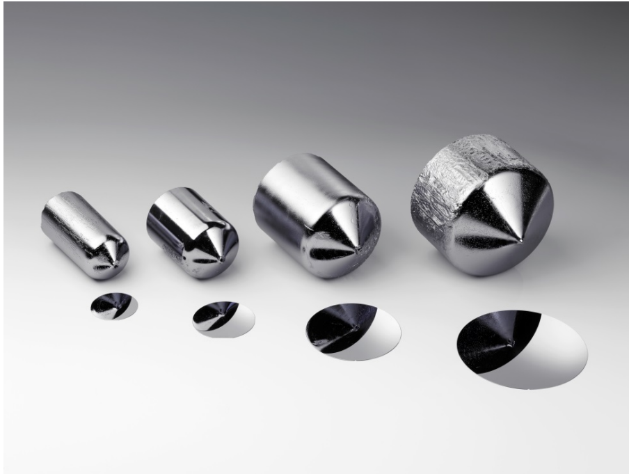
Galliumarsenid-Kristalle mit verschiedenen Durchmessern, hergestellt nach dem VGF-Verfahren.