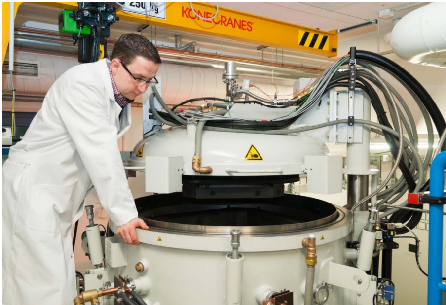
Die Anlagen zur Herstellung von multikristallinen Silizium-Blöcken für die Herstellung von Solarzellen sind etwa 3-4 m hoch.